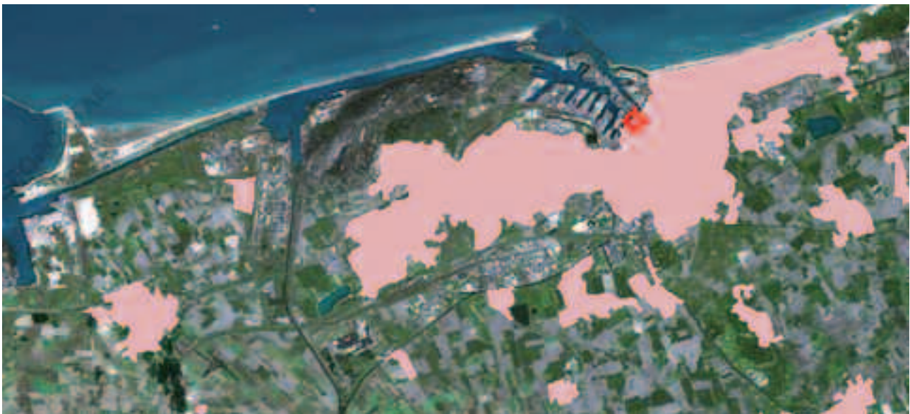
Fig. 7 – Les "surfaces bâties" de l'agglomération dunkerquoise

Les aménagements sont au cœur de conflits d'intérêts des habitants par la coexistence dans un périmètre restreint du résidentiel et de l'industriel. La perspective de la construction future d'un terminal méthanier exacerbe les tensions, alors que la ZIP est un pôle d'emploi et une opportunité financière (taxe professionnelle), et que l'important espace en réserve pourrait permettre à Dunkerque d'affirmer de plus grandes ambitions.