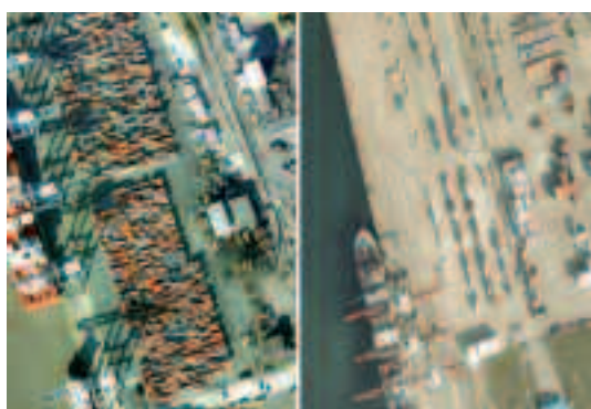
Fig. 3 – Vue comparée des ports à conteneurs de Tilbury (à gauche) et Dunkerque (à droite)

▶ Aller plus loin avec Google Earth : Le professeur « reprend la main » (fonction « présenter » dans NetSupportSchool ) et montre aux élèves quelques escales possibles d'un cargo empruntant cette ligne maritime pour montrer l'insertion de Dunkerque dans un cabotage européen (Tilbury au R-U. => Rotterdam aux P-B. => Dunkerque => Le Havre) grâce à la fonction « visite » (disponible dans Google Earth 5.0 et qui permet d'enregistrer un itinéraire balisé). Il s'agit d'une comparaison visuellement parlante ; Tilbury (R-U) ou Rotterdam (P-B), se prêtent aisément à la démonstration... tant sur le plan des superficies qui relèguent Dunkerque à une place davantage régionale que mondiale, qu'au plan de la situation du port sur le littoral : de