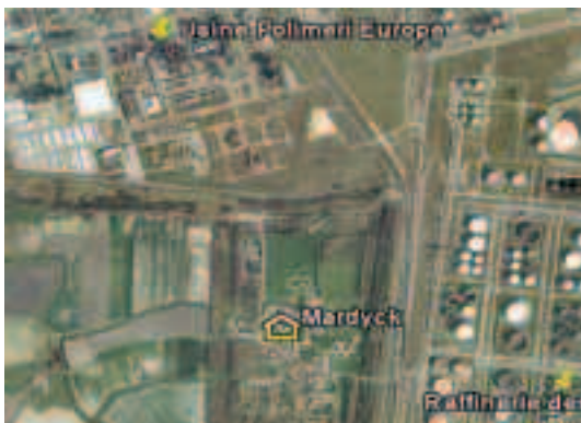
Fig. 6 – Mardyck, hameau très proche de 2 sites SEVESO

Petite évaluation (informelle) grâce à l'ardoise électronique : sur le modèle de celle utilisée par mes élèves ( http://nfjarnier.free.fr/ardoise/site/accueil.htm ) : les élèves ouvrent l'ardoise, répondent à trois questions (Qui sont les témoins du reportage ? Quels inconvénients sont évoqués par les habitants ? Quelle image de Dunkerque, le reportage donne t-il ?). Le professeur apporte éclaircissements dans une reprise collective : pourquoi vivre si près des industries ? Cette image « si » négative est-elle la seule réalité ? Alors, pourquoi ces inquiétudes ?