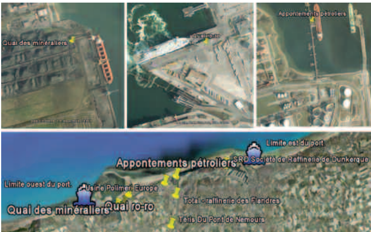
Fig. 5 – Gestion de l'hétérogénéité grâce aux TICE : activité complémentaire : fixer de nouveaux repères dans le fichier kmz ; identifier d'autres terminaux sur le port central et le port est (« punaises » et commentaires) ; réinvestir le vocabulaire spécifique (quai, conteneurs, pétroliers, etc...).

En cochant et décochant les cases du menu, l'élève se dirige vers les lieux à observer choisis, peut lire des commentaires ou des questions préétablies, peut superposer d'autres couches d'information... et profite d'un paysage original dont l'étude reste assez peu fréquente en cours.