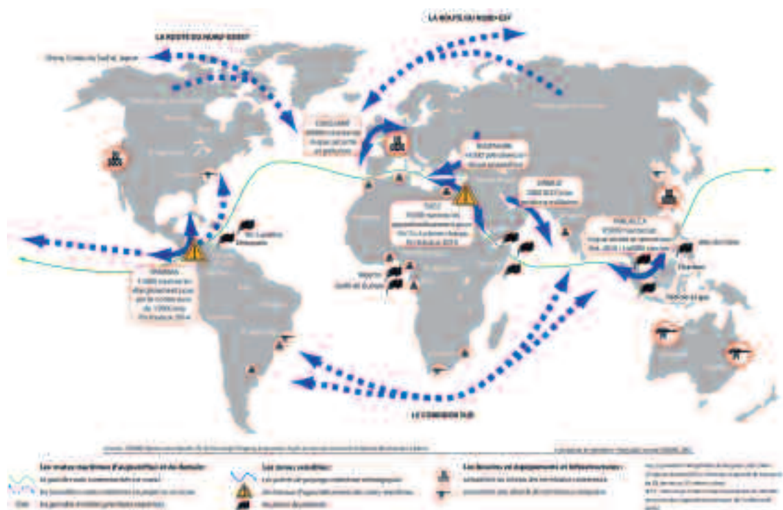
Fig. 1 – La saturation des routes maritimes mondiales