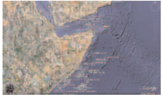
Fig. 3 & 4 – Les attaques de piraterie 2002-2007

Entre 2002 et 2004, les actes de piraterie concernent essentiellement le Golfe d'Aden. À partir de 2005, les actes de piraterie se poursuivent dans le Golfe d'Aden mais gagnent la côte sud-est de la Somalie ce qui étend considérablement la zone à surveiller par les différentes forces navales...