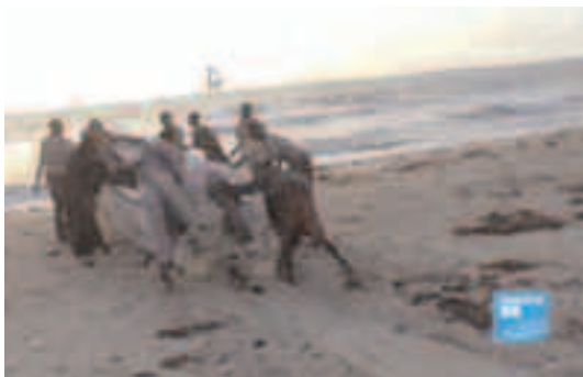
Fig. 5 – Des bases terrestres pour les pirates